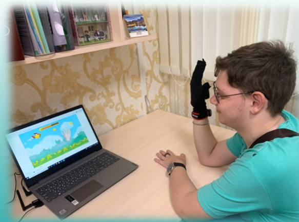
Оборудование МРЦ «ВИЗИТ» - Реабилитационная перчатка «Senso Rehab» (умная перчатка)