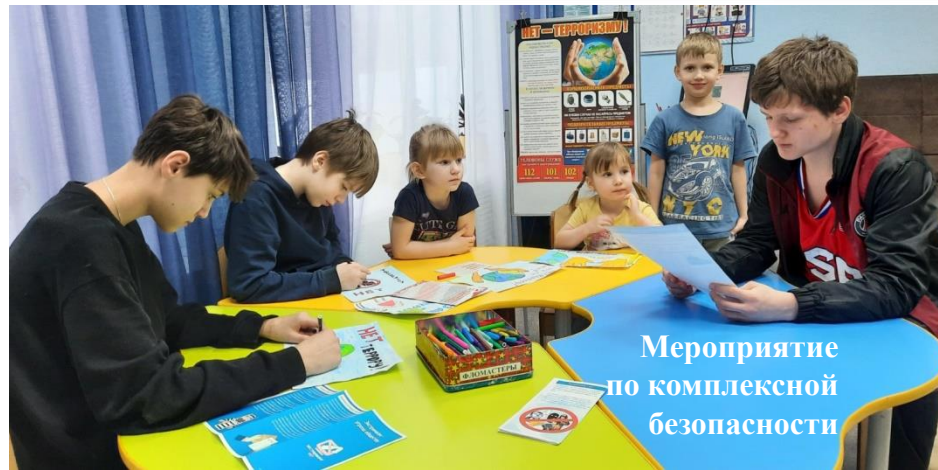
Мероприятие по комплексной безопасности