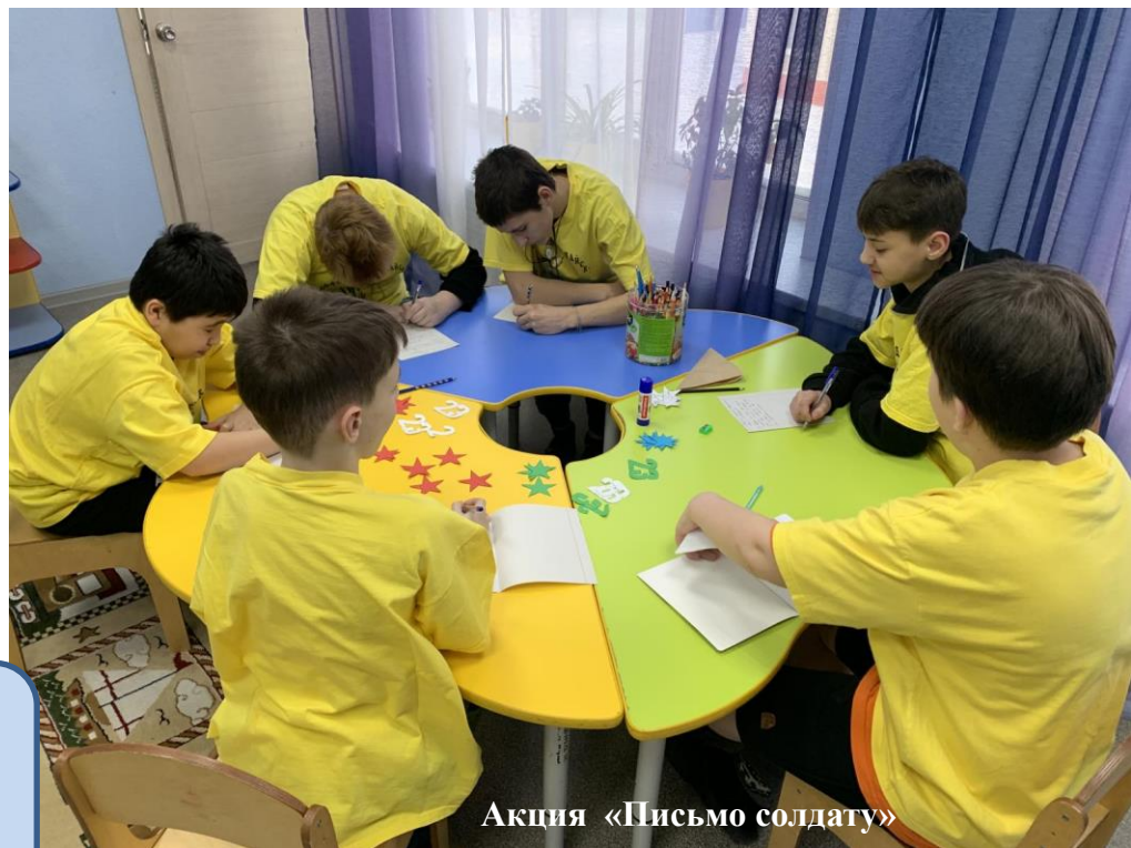
Акция «Письмо солдату»

Развитие гармонично-духовной личности несовершеннолетних на основе патриотических и культурно-исторических традиций, популяризация волонтерской деятельности