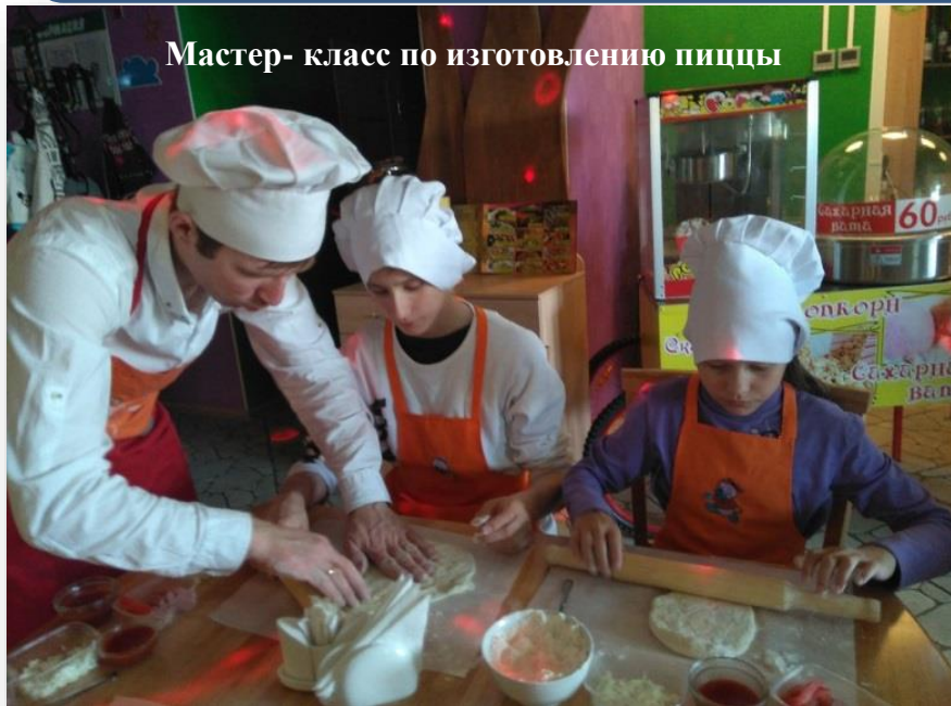
Мастер- класс по изготовлению пиццы

Формирование навыков самостоятельности и социально – бытовой адаптации, здорового образа жизни, освоение правил личной безопасности