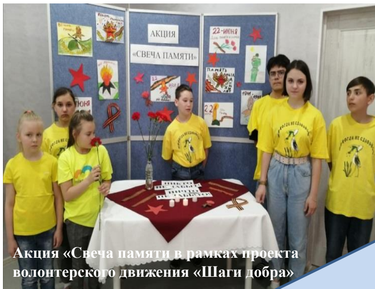
Акция «Свеча памяти в рамках проекта волонтерского движения «Шаги добра»